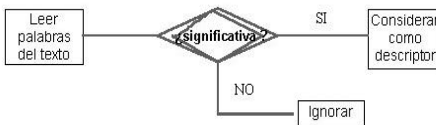
Fig. 1. Esquema del funcionamiento del algoritmo (Robredo 15 )

Estos primeros intentos se basaron en la identificación de las palabras que aparecían en títulos 14 de artículos científicos. Para hacerlo se utilizaba una base técnica muy sencilla: las palabras se consideraban como objetos exclusivamente y por tanto, desde su significante. Para llegar a ser una entrada del índice las palabras pasaban primero por el filtro de un antídiconario, cualquier palabra que constase en éste (palabra vacía) y en la unidad que se debía indizar, se eliminaba, y así, las que permanecían se consideraban significativas y pasaban a ser elementos de indización. En la base de cualquier proceso de indización automática se iba a situar desde entonces un algoritmo, cuyo funcionamiento se puede explicar en tres pasos, según muestra en la figura: