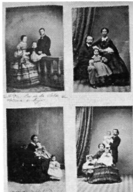
Ilustración 007: Anónimo. Colección Castellano. Biblioteca Nacional, Madrid.