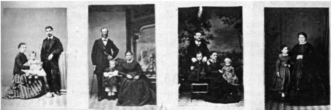
Ilustración 006: Anónimo. Colección Castellano. Biblioteca Nacional, Madrid.

Dentro de los retratos familiares podemos diferenciar un primer repertorio de fotografías formado por aquellos hechos en el estudio, basándonos de nuevo en los fondos de la Colección Castellano [6] y [7]. En estos retratos grupales entra en acción un elemento nuevo: la disposición de los personajes en el espacio representacional, ya que al tratarse de la construcción de un emblema familiar, la proyección del grupo se construye a través de los códigos de la pose y la relación entre los componentes.