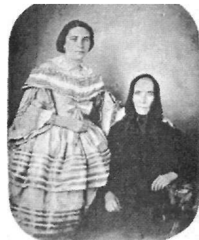
Ilustración 004: K. Napoleón. Madre e hija. 1857

También encontramos fotografías de madres de más edad con sus hijas maduras. Un caso interesante es el daguerrotipo de Napoleón de 1855 [4], donde inmediatamente se produce un desencuentro visual entre ambas debido no a la edad sino a la vestimenta: La madre viste de riguroso luto y su atavío es propio del ámbito rural, la hija, por el contrario, sigue la moda burguesa y es un ejemplo característico de la ciudad. En este caso es la mujer más joven la que se encuentra de pie en actitud de proteger o acoger a su madre, que sentada inmóvil mira a la cámara 11 .