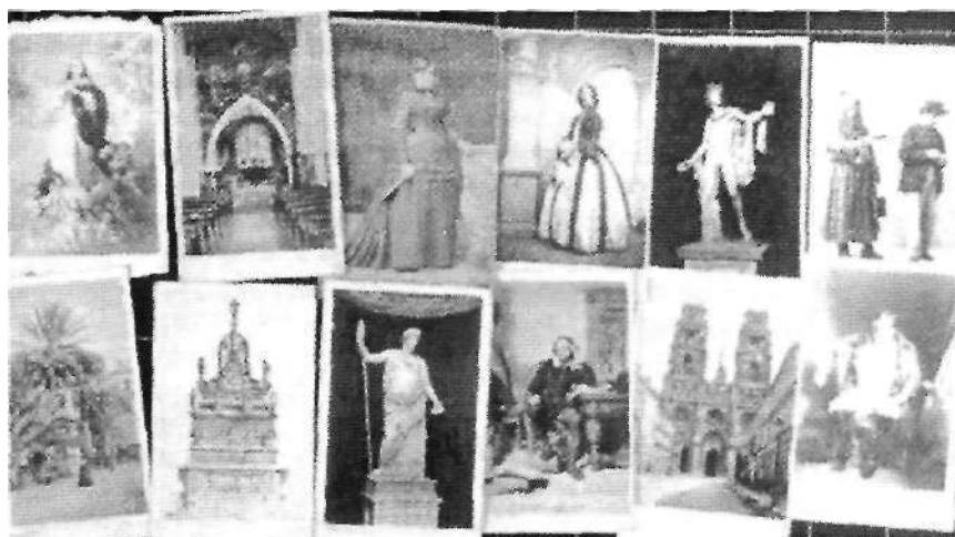
Ilustración 012: Bernardo Riego. Tarjetas de visita en álbumes

En él abundaba el formato tarjeta de visita y se reúnen desde los más allegados, hasta celebridades de la política o de la escena, vistas y reproducciones de obras de arte, intentando construir unas redes de conocimiento del mundo que nos hablan de la concepción y la mentalidad de la familia pero también de las implicaciones sociales y políticas 20 . [12]