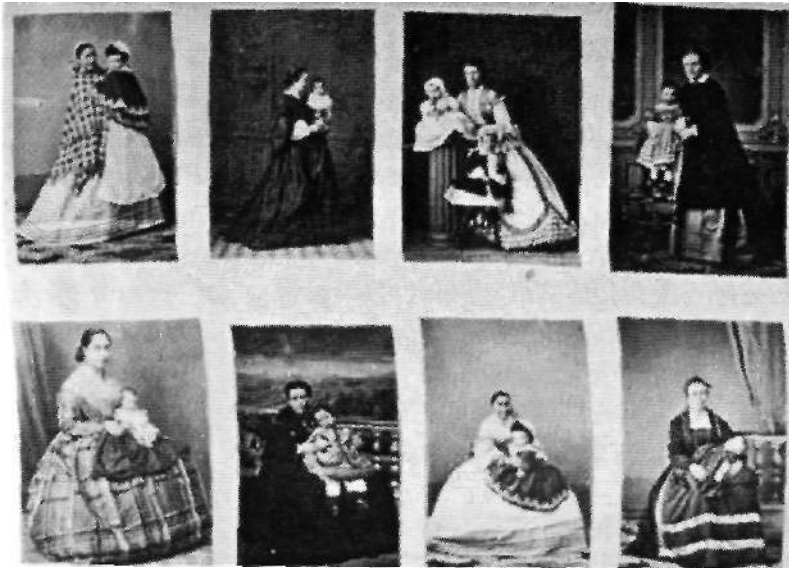
Ilustración 002: Anónimo. Colección Castellano. Biblioteca Nacional, Madrid