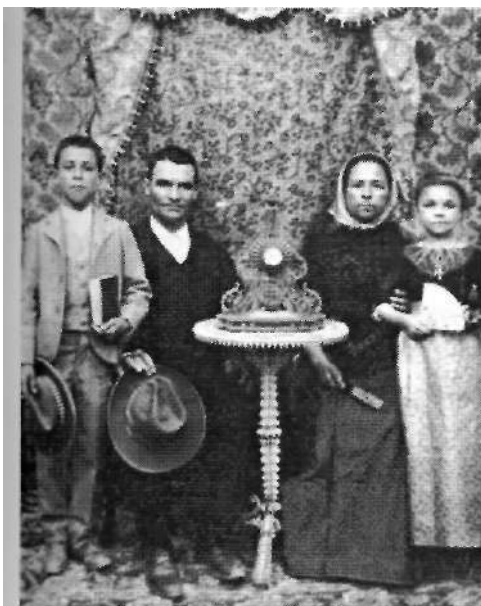
Ilustración 010: Tomás Montserrat. Campesinos vestidos de domingo.

Lo mismo ocurre con Campesinos vestidos de domingo , de Tomás Montserrat, (1920) [10]. Encontramos una nueva disposición ya que son los padres los que están centrados, con un hijo a cada