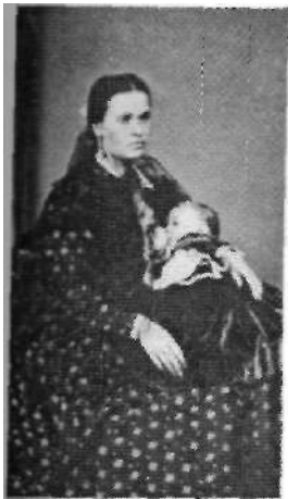
Ilustración 003: Anónimo. Colección Castellano. Biblioteca Nacional, Madrid. 1857

En la misma Colección, encontramos una fotografía de una tipología distinta [3] tanto en lo que se refiere al formato, ya que no es tarjeta de visita y tiene mayor calidad, como en lo referente al tema: ha captado un momento mucho más íntimo, cuando la madre amamanta al bebé. Sin duda se sale de lo común, parece que la representación del pecho desnudo no se encuadra en los regímenes de visibilidad de la época, pero al introducirse en el poderoso estereotipo de madre, desactiva las posibles implicaciones sexuales y la fotografía funciona, subrayando esa importante iconografía de madre nutricia, que, de nuevo por el decoro y el carácter de huella, no es habitual.