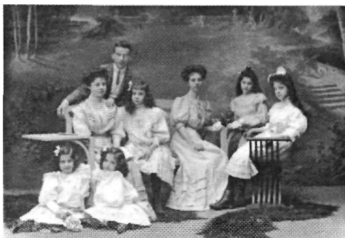
Ilustración 008: Frazen. Retrato de familia. 1900

En la composición, se suele jugar con las alturas buscando disposiciones piramidales asumidas de los retratos pictóricos, y así otorgando a la fotografía la categoría de lo artístico. En disposición espacial, tiene un papel importante el juego entre la proyección de las distintas miradas, que expanden el espacio. La escena vuelve a intentar recrear el interior doméstico burgués y lugar natural donde se toman estas fotografías, la casa.