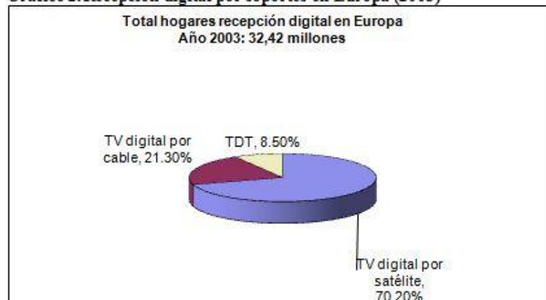
Gráfico 2. Recepción digital por soportes en Europa (2003)