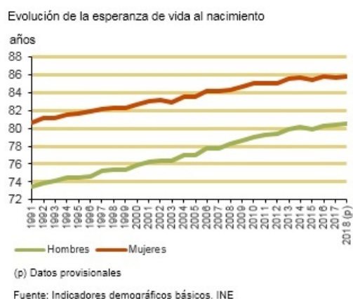
Figura número 1.

1.2 Número de disposiciones testamentarias o declaraciones de herederos realizadas, según estudio en diversas Notarias.