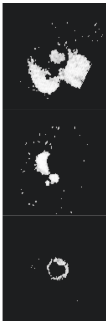
Figura 2. Resultados de la segmentación automática. Arriba: ventrículo izquierdo y pulmones. Centro: ventrículo derecho y

En la figura 2 se ilustran los resultados de la segmentación automática en uno de los estudios de ^{13}\text{NH}_3 . El ventrículo izquierdo se segmenta junto con los pulmones, dado que la curva media de actividad de estos últimos es más parecida a la de ese ventrículo que a cualquiera de las otras dos regiones. La región segmentada de ventrículo izquierdo queda completamente dentro del mapa de correlación correspondiente al miocardio. El resultado se alcanzó tras 10 iteraciones, que tardaron una media (para los tres casos) de 27.29 \pm 1.78 segundos en el ordenador de prueba.