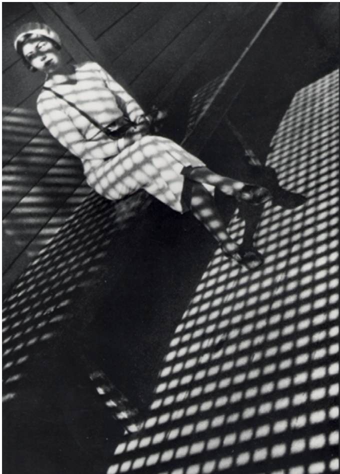
Chica con Leica

lanzan una propuesta de cómo (estructuralmente, y no exclusivamente desde el punto de vista temático), representar la revolución. Atributos estructurales como la imperfección, la desestabilización, el “ruido”, la mezcla de solidez del objeto y de “fragilidad” del encuadre, la cotidianeidad del contenido y la radicalidad del punto de vista, hacen confluír en sus imágenes la mirada de Apolo y la de Dionisio. Todos ellos son elementos que niegan la idea de revolución como consumación, como meta o estación termini , para plantearla como proceso, como movimiento dialéctico que rehúye todo reposo, todo acabamiento, toda perfección, transparencia o naturalización del relato.