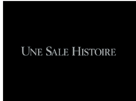
Fotograma 1: Retórica ficcional