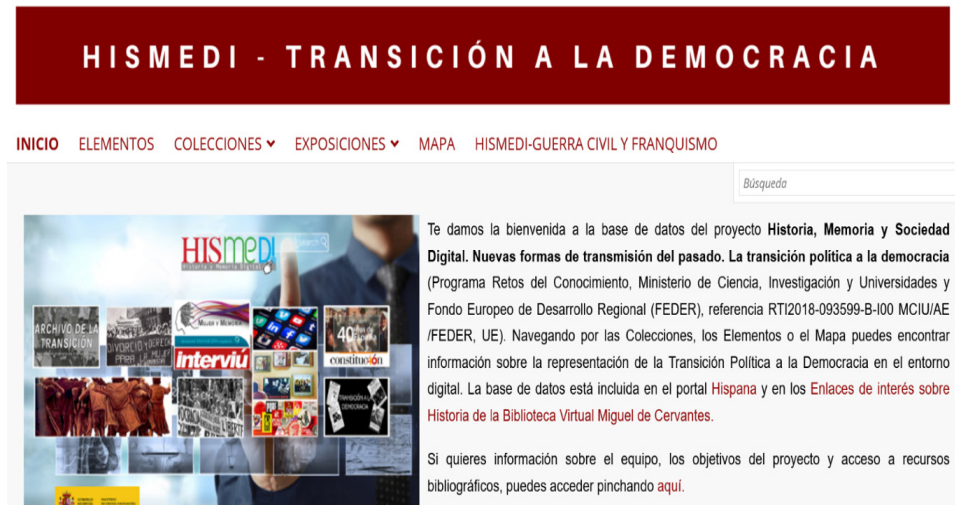
Figura 1. Proyecto HISMEDI-Transición a la Democracia.

Para su creación se elaboró una taxonomía con conceptos y personajes de la transición y con los tesauros de PARES, del archivo Linz y del proyecto TRANSLITEME. Con estos conceptos se procedió a la búsqueda de fuentes disponibles y los hallazgos se categorizaron según los metadatos recogidos por Dublin Core para ser incluidos posteriormente en el software de OMEKA –que funciona como una base de datos–.