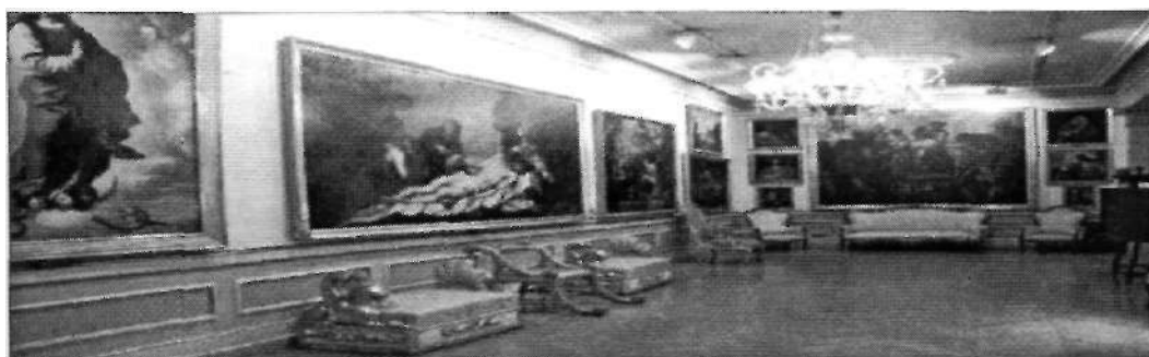
Imagen n°6: Una de las galerías de pintura, en la planta entresuelo del Museo Cerralbo.

El Marqués de Cerralbo siempre tuvo presente la idea de crear un museo que sirviese para el estudio de los aficionados a la ciencia y el arte, como atestigua su testamento. Ya en vida rotuló todas las obras de arte y organizó diversas exposiciones de numismática y arqueología en su palacio, convirtiéndose, desde un primer momento, en residencia y museo. Originalmente, pensó emplazar el museo en el palacio de San Boal en Salamanca, una de las muchas posesiones del Marqués, pero enseguida desistió ya que aquel antiguo caserón no ofrecía las condiciones de seguridad necesarias.