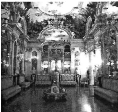
Imagen nº4: Salón de Baile