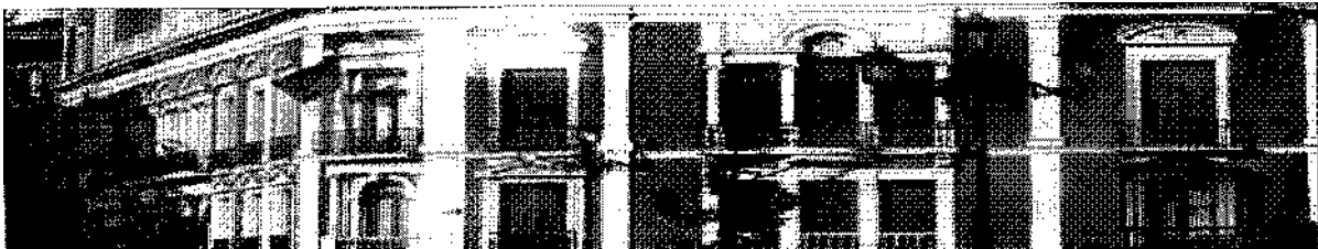
Imagen nº3: Chaflán del Palacio Cerralbo a la calle Ferraz con Ventura Rodríguez 3

Se levanta sobre un zócalo de sillería de granito, como disponen las ordenanzas municipales - por su impermeabilidad, salubridad e higiene-. Se recurre a la bicromía propia del Barroco madrileño, lograda mediante la alternancia de ladrillo y granito, o en su defecto piedra artificial o enfoscado, para los elementos ornamentales de jambas, frontones y pilastras. Siguiendo la moda francesa se recurre al chaflán esquinero, que llega a Madrid en torno al cambio de siglo y se impone en casi todos los edificios realizados con posterioridad.