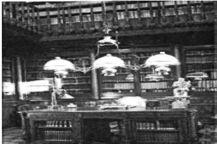
Imagen nº5: Biblioteca

El interior se distribuye en torno a un patio central rodeado de galerías, que se adoptan como solución al deseo del Marqués de crear una galería de arte o museo. Por otra parte, esta disposición era muy habitual en las residencias españolas, y procedía directamente del atrio romano. Este trazado se ve