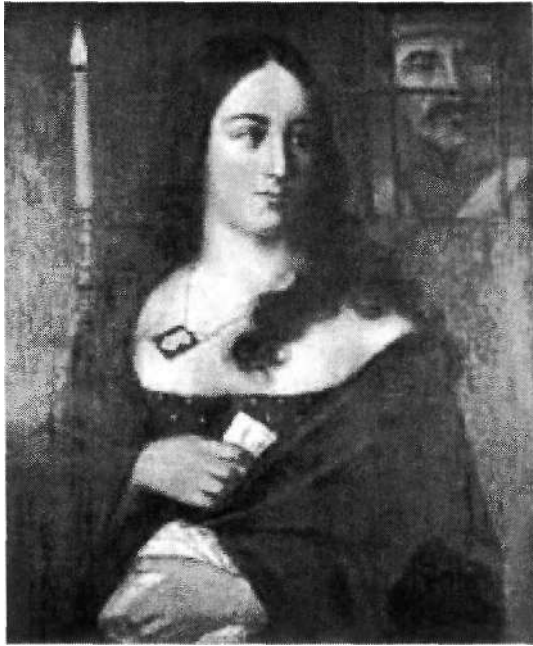
Fig. 9. José María Espinosa La Pola en capilla Óleo sobre tela H. 1857 Concejo Municipal, Villa de Guaduas