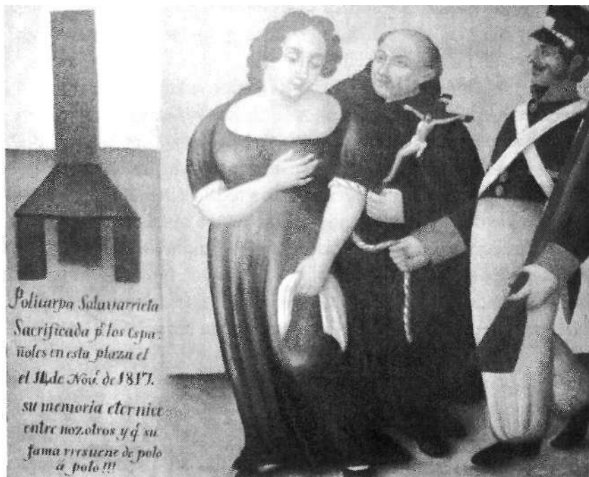
Fig. 11. Anónimo. Policarpa Salatierra marcha al suplicio, h. 1825. Óleo sobre tela. Museo Nacional de Colombia