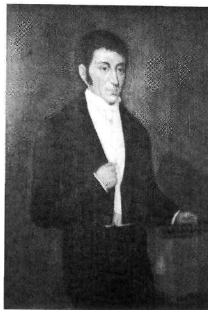
Fig. 2. Anónimo. Francisco José de Caldas s. XIX. Óleo sobre tela. 146x115,5 Museo 20 de julio, Bogotá