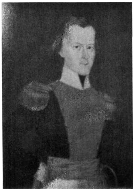
Fig. 5. José María Espinosa Atanasio Girardot s. XIX. Óleo sobre tela. 89x79 Museo 20 de julio, Bogotá

Al margen de la relevancia de personalidades particulares y de la composición de las dos generaciones de prohombres protagonistas de la emancipación recogidos en la iconografía colombiana 3 , los proceres son representados bajo dos modelos posibles. Uno, bajo la paradigmática solemnidad militar, y, dos, bajo la seriedad propia del alto cargo político que ocupan. No obstante, en términos generales, la iconografía de los proceres neogranadinos, es similar al de otras repúblicas hermanas y mantiene líneas comunes de representación como el hieratismo en la figura, preciosismo en los detalles, forma cerrada, predominio del dibujo descriptivo, presencia del color saturado, reiteración de las formas y poses de los retratados 4 , como se observa en los siguientes retratos (Figuras 1-6).