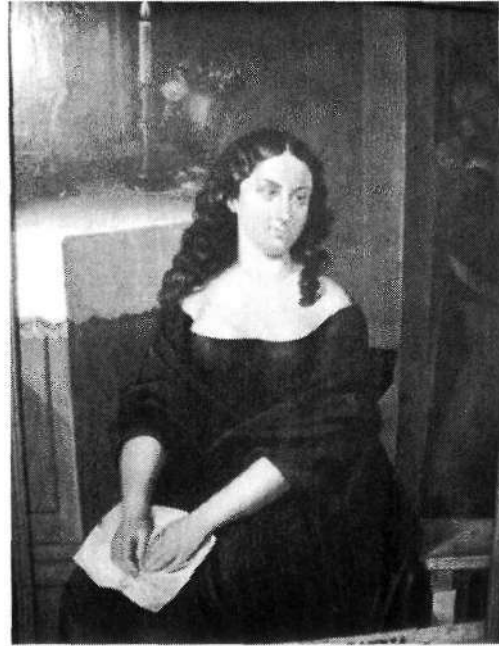
Fig. 10. Epifanio Garay Policarpa Salavarrieta s. XIX. Oleo sobre tela. H. 1890 Museo Nacional de Colombia