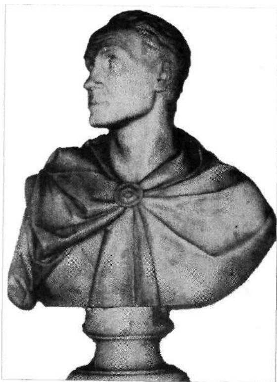
Fig. 7. Simón Bolívar Busto de Tenerari (1832)