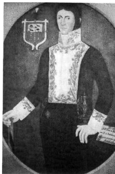
Fig. 4. Antonio Palomino José Acevedo y Gómez s. XIX. Óleo sobre tela. 125,5x100,5 Museo 20 de julio, Bogotá