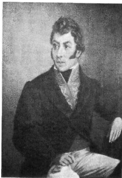
Fig. 3. José María Espinosa (atrib) Atanasio Girardot s. XIX. Óleo sobre tela. 145x103 Museo 20 de julio, Bogotá