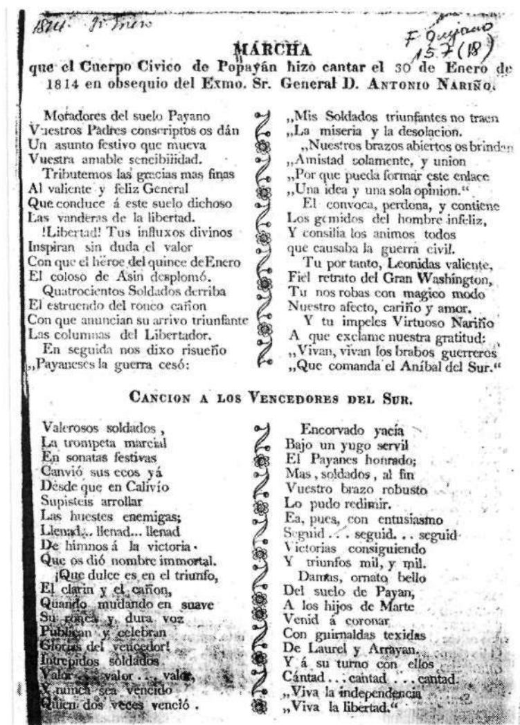
Figura 13. Marcha que el Cuerpo Cívico de Popayán hizo cantar el 30 de Enero de 1814 en obsequio del Exmo. Sr. General D. Antonio Nariño. Imprenta del C. Bruno Espinosa, Santafé de Bogotá, 1814.

Los modelos de virtud republicana no sólo fueron masculinos, también las nuevas ciudadanas dispondrán de paradigmas referenciales y especulares en al Antigüedad clásica. Así, en los primeros días de la revolución de independencia neogranadina se acudió a las antiguas romanas para describir la heroica acción de una anónima mujer santafereña el 27 de agosto de 1810 en el Diario Político de Santafé de Bogotá ", y el propio Nariño, buen conocedor del Mundo Clásico, se valdrá del referente romano de las matronas en el número 15 de La Bagatela (13 de octubre de 1811) 18 , cuando en La Carta del Filósofo sensible a un Amigo, cita el conocido episodio de la donación de las joyas de las matronas a la República Romana.