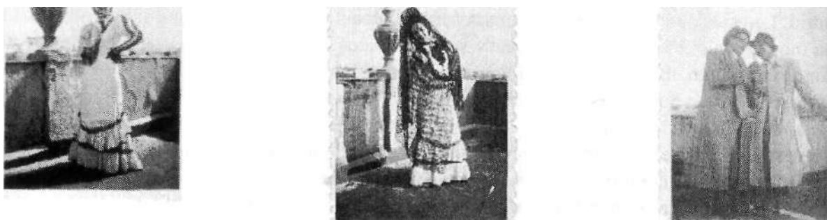
1945. Goyesca, flamenca y dos hombres ebrios.

El estudio de estos álbumes nos ha proporcionado dos tipos de información. Por un lado, estudiamos cómo fechar fotografías y por otro, analizamos el impacto de la cámara automática en las fotografías de la vida cotidiana en España. Ambos aspectos de este estudio se ha llevado a cabo principalmente a través de la observación.