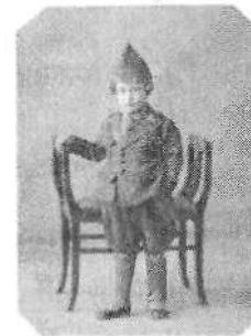
1931. Disfraz de soldado republicano.

Además con el tiempo se va añadiendo otro personaje uniformado, el del estudiante también fotografiado por profesionales hasta el año 2000. En total, recogimos una muestra de 14 retratos de figuras de uniforme.