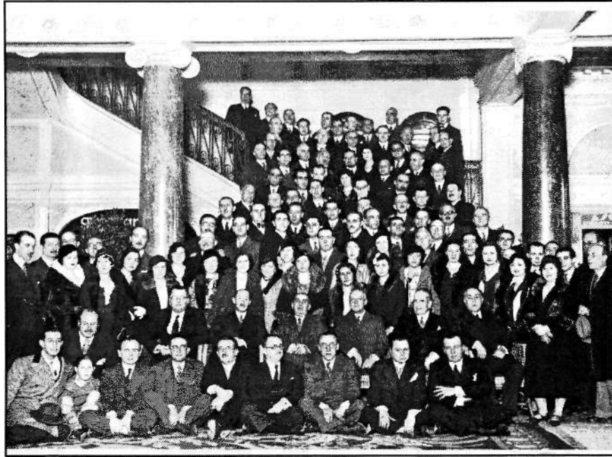
AHN, SECRETARÍA,672,N.56 Participantes en la Asamblea del Cuerpo Facultativo de Archiveros, Bibliotecarios y Arqueólogos en el vestíbulo del Hotel Nacional (Madrid) 1931, diciembre Positivo monocromo sobre papel (255x330 mm.)