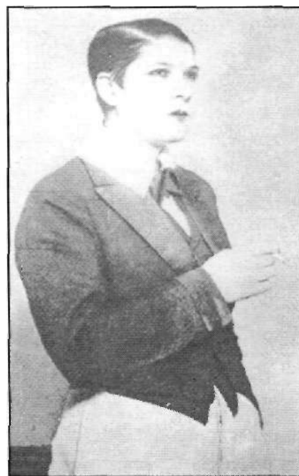
Lámina 1: "Artista norteamericana con traje masculino" en MILLA, Fernando de la: "El devenir inexorable. La Mujer Moderna", Por esos Mundos , 20 (1926).

El periodista y crítico literario cordobés, Cristóbal de Castro 5 , contemplaba la sensualidad española como algo tráfico, feroz, intransigente y sumamente calderoniano 6 . No es de extrañar que entre la opinión pública se divulgara la idea de que las prerrogativas de la vida moderna atentaban contra el casticismo. Para los/as españoles/as era muy difícil desarraigarse del atavismo que vinculaba el sexo al vestido y, poco menos que imposible, que se matizara esa sensualidad para estar más acorde con el frenético dinamismo de la era moderna. Las mujeres tenían la eterna obligación de reafirmar aquellas cualidades que se vinculaban a su sexo;