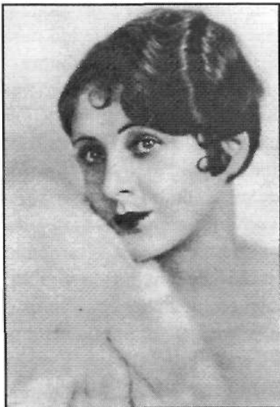
Lámina 20: "La actriz cinematográfica Billie Dove, cuya imagen demuestra que la moda del pelo corto no andaba en absoluto reñida con la idealidad de la belleza femenina" en ANÓNIMO: "Tres retratos", Blanco y Negro , 2.084 (1931).