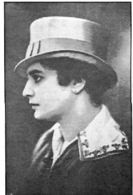
Lámina 19: "Sombrero 'chapelier' de forma 'incroyable', de seda gris, creación de la casa Petite leannette" en SAINT-GERMAIN, Condesa de: "La moda desde París", La Ilustración Española y Americana , 21 (1917), p. 334.

parecieron las mujeres, por un lado por todos los cambios producidos en su forma de pensar, sentir y actuar; y, por otro, por la subversiva reacción que casi la totalidad del género masculino manifestó frente al desapego de las mujeres hacia los seculares presupuestos marcados por la despótica sociedad patriarcal. Un cronista del Blanco y Negro contaba que, en Berlín, un director y propietario de una gran fábrica de prendas de vestir, publicó un anuncio en varios periódicos de la ciudad notificando que necesitaba una mujer a quien conferir un cargo de confianza en sus almacenes. Una señorita de Hannover, de