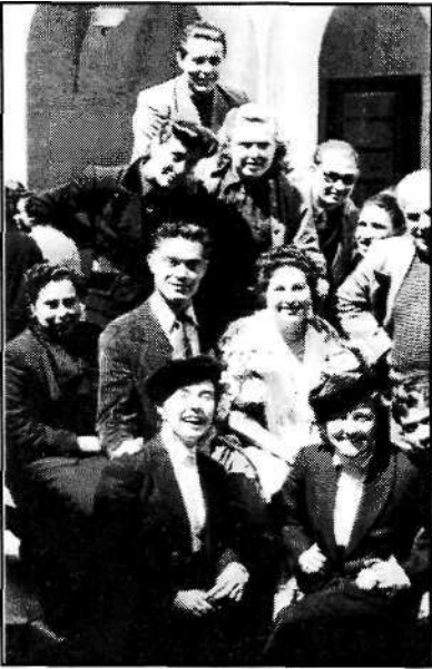
Foto 10: Repatriados de Rusia (Escuela de Mandos de SF, 8 abril 1954)