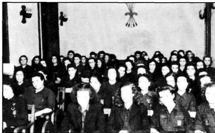
Foto 2: Lección de Nacional-Sindicalismo (Escuela de Hogar, 1940)

« Animo, mujer, a cumplir ignoradamente y en silencio, tu nueva y gloriosa misión » 9 . (Foto 2).