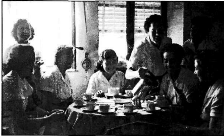
Foto 21: La merienda de las instructoras de un albergue (junio 1956)

La segunda, en la salita de un albergue en 1956, es ya totalmente informal y representa, más allá del aspecto externo, una reunión de amigas a la hora del café, reconfortadas además por la privacidad que da la penumbra. (Foto 21)