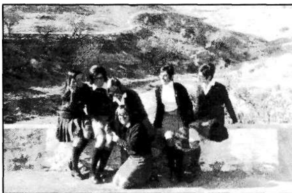
Foto 17: Cátedra ambulante en Uleila del Campo (20 diciembre 1970)

Las de las seis miembros de la cátedra ambulante que en 1970 revolucionó Uleila del Campo , cuando llegaron conduciendo su propio coche, con las minifaldas, las gafas de azafata televisiva y sus melenas "a lo garçon". (Fotos 17 y 18). ¿Qué pensarían los jóvenes y viejos del pueblo?, ¿las amas de casa?, ¿sus hijas?