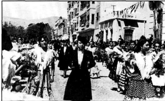
Foto 4: Desfile Coronación Canónica de la Virgen del Mar (8 abril 1951)

Las que después de los ejercicios espirituales, decoraban con flores el altar de los Caídos y, tocadas con mantilla, oían misa antes de actuar en coro los domingos ( Foto 5, 6, 7).