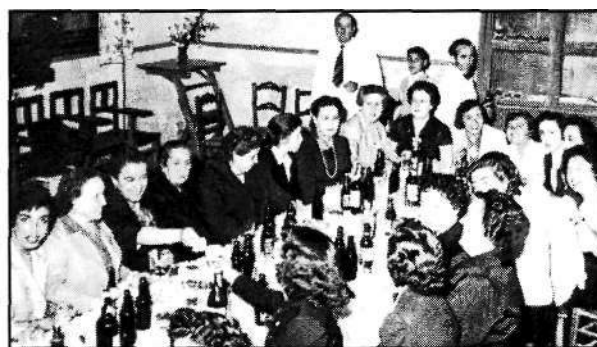
Foto 20: Profesoras de Instituto de Enseñanza Media (Almería, 31 mayo 1957)