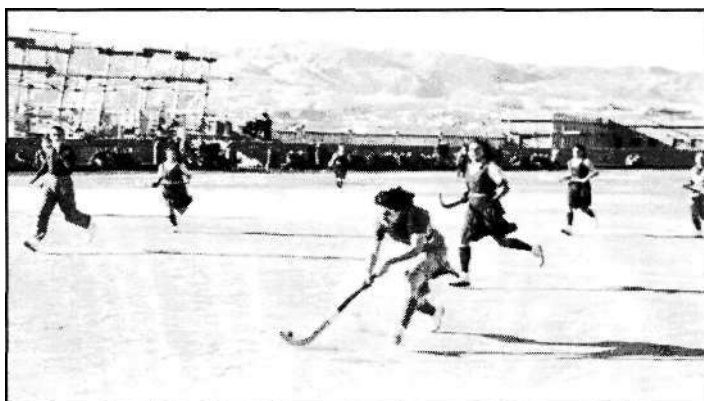
Foto 12: Competición de hockey en el Estadio de la Falange (Almería, años 40)

Nos referimos a esas chicas que aparecen en las fotografías corriendo con "pololos" y "stick" en mano 26 , peleando como "leonas" la victoria en las canchas de baloncesto, o en deportes tan poco comunes en la Almería de los años cuarenta como el "hockey" (Foto 12).