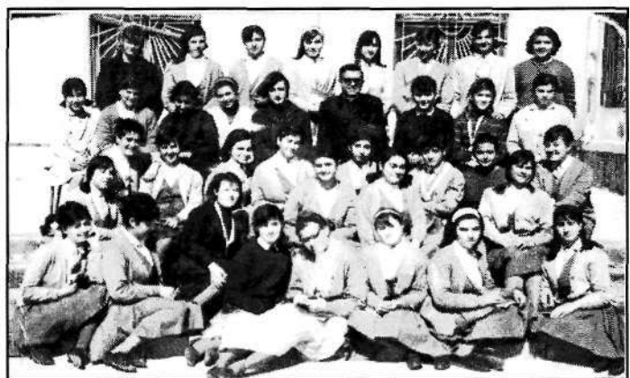
Foto 7: Ejercicios espirituales en el albergue de Aguadulce (años 60)