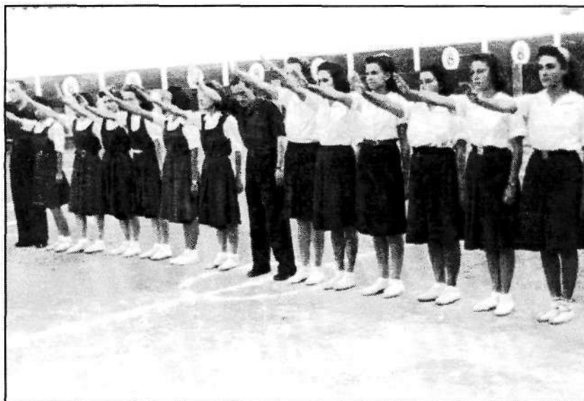
Foto 1: Primera Concentración de O.J. (Plaza de toros de Almería, 1 abril 1940)

Aunque pertenezcan a álbumes privados, sabemos que no fueron ellas quienes presionaron el obturador. Reporteros gráficos ( Foto Quintana, Foto Bayo, Portillo o Ruiz Marín ), o simples encargadas de hacer la foto testimonial, recogieron las castas faldas-pantalón perfectamente alineadas y los brazos en alto cantando himnos patrióticos antes de empezar el partido, en otra simbólica plaza de toros: primera concentración de Organizaciones Juveniles en Almería, allá por el año 1940. (Foto 1) 8