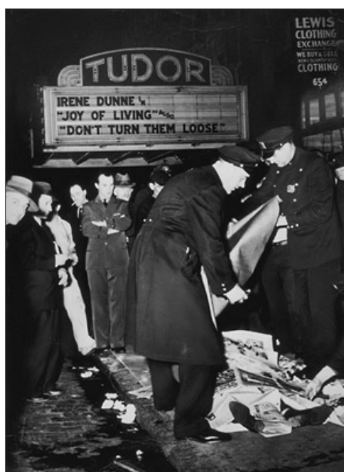
Joy of Living (17 de abril de 1942)

Se trata de un movimiento congelado, de un momento de profundo pathos paralizado por la cámara fotográfica. Al igual que en la anterior escena, la imagen ha sido obtenida de tal manera que gracias a las estructuras exteriores del coche la imagen queda perfectamente encuadrada y limitada, no produciéndose ninguna sensación de espacio fuera del formato de la imagen.