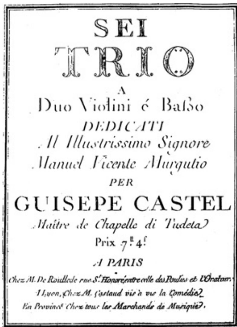
Ilustración 2. Portada de la edición de Sei Trio a Duo violini e Basso de José Castel (Paris, [F.] de Roullede, ca. 1785)

Cinco de los seis tríos que componen la colección de Castel están escritos en tonalidades mayores y uno en menor, una práctica habitual en gran parte de las colecciones de música de cámara editadas en la segunda mitad del siglo XVIII 41 . Todos aparecen articulados en tres movimientos, a excepción del Trío IV (en Sol menor), que tiene cuatro tiempos.