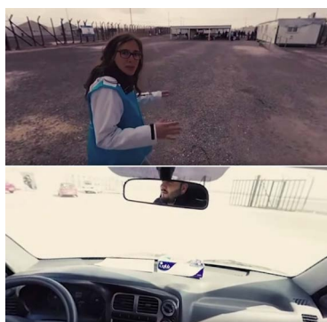
Cuadro 3: Fotogramas de “En la piel de un refugiado”

“En la piel de un refugiado” busca también la interacción del espectador en el relato añadiendo secuencias en movimiento, de modo que generen la sensación de caminar en la escena o de montar en un vehículo (Cuadro 3). Estos resultados coinciden con la intencionalidad que explica su director de crear un entorno pensando en lo que el espectador va a ver cuándo acceda a través del visor.