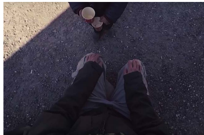
Cuadro 2: Fotograma de “En la piel de un refugiado”

Como hemos señalado, el espectador aparece representado a través de una figura, de tal modo que, cuando dirige su mirada hacia abajo, observa un cuerpo con el que se puede identificar. Para ello se ha empleado un figurante que utiliza una vestimenta neutra (pantalón y jersey) y no lleva adornos. Aunque ni su edad ni su sexo están muy definidos, se deduce que se trata de un varón joven (Cuadro 2):