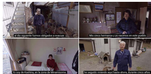
Cuadro 4: Fotograma de “Fukushima, vidas contaminadas”

frente a ellos, al tiempo que puede recorrer la escena en 360°. Sin embargo, a diferencia del caso anterior, el rol de éste se limita a observar sin que se simule su presencia dentro del relato: los personajes no demandan su participación, sino que se limitan a hablar directamente a cámara, no sin cierta rigidez. Esta representación, cuya dificultad –apunta Verdú– viene condicionada por el hecho de que los personajes tengan que “enfrentarse” solos a la cámara, genera en el espectador cierta distancia respecto a la realidad representada. La separación se hace aún mayor al añadir óculos para introducir a cada uno de los personajes que aparecen y subtítulos para traducir sus testimonios (Cuadro 4):