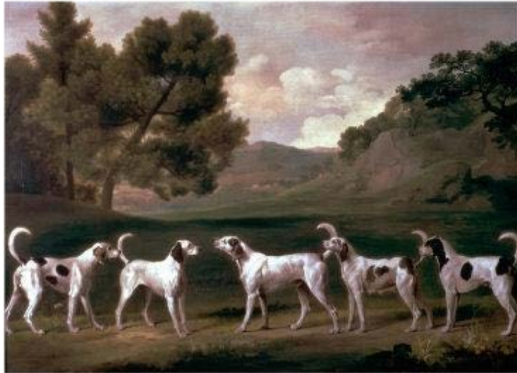
George Stubbs. "Foxhounds"