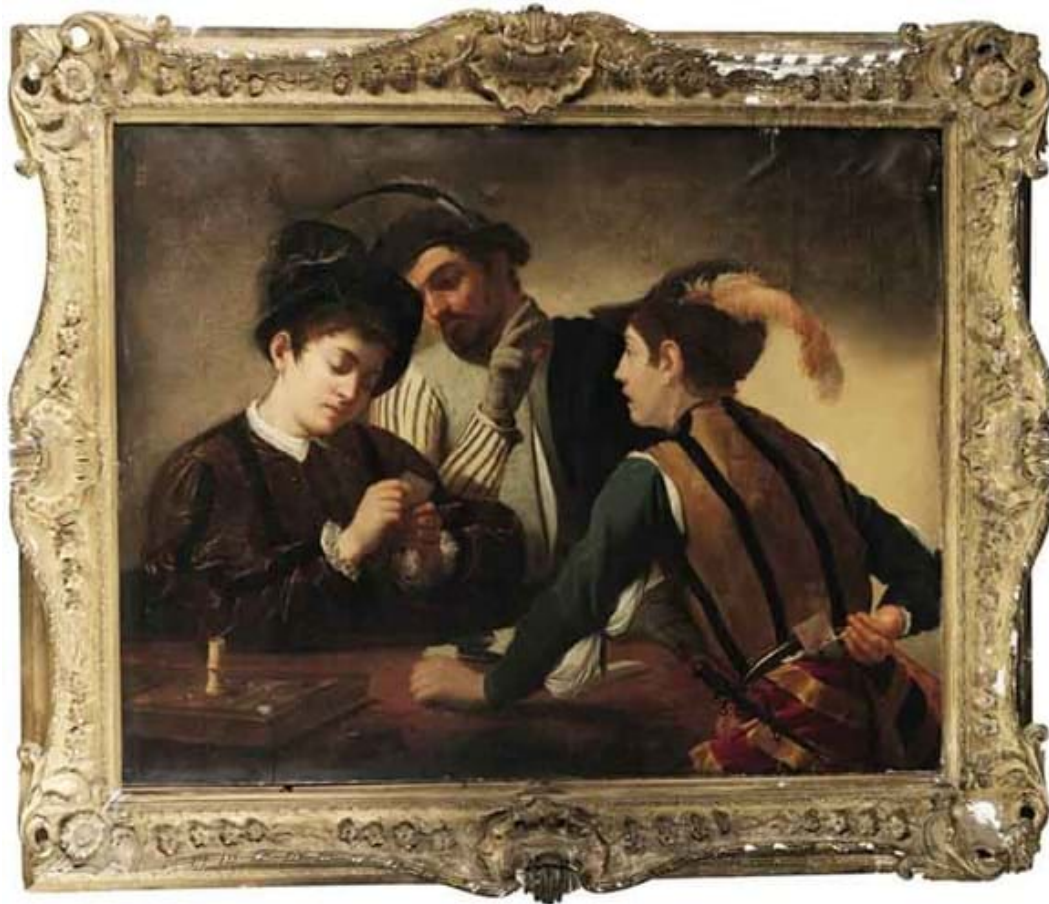
Caravaggio. "Los tahúres"