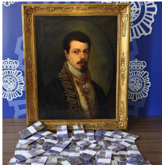
Retrato de Antonio María Esquivel (SAP Gerona 29/1/2009)