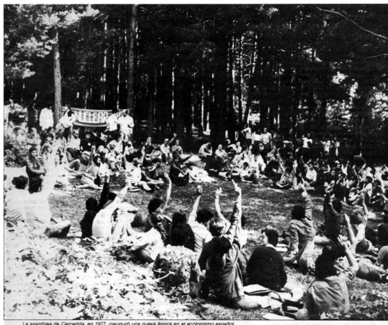
Figura 2. Imagen de la asamblea de Cercedilla, 1977. 7