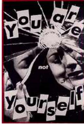
We have received orders not to move