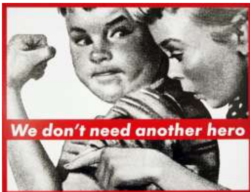
We don't need another hero