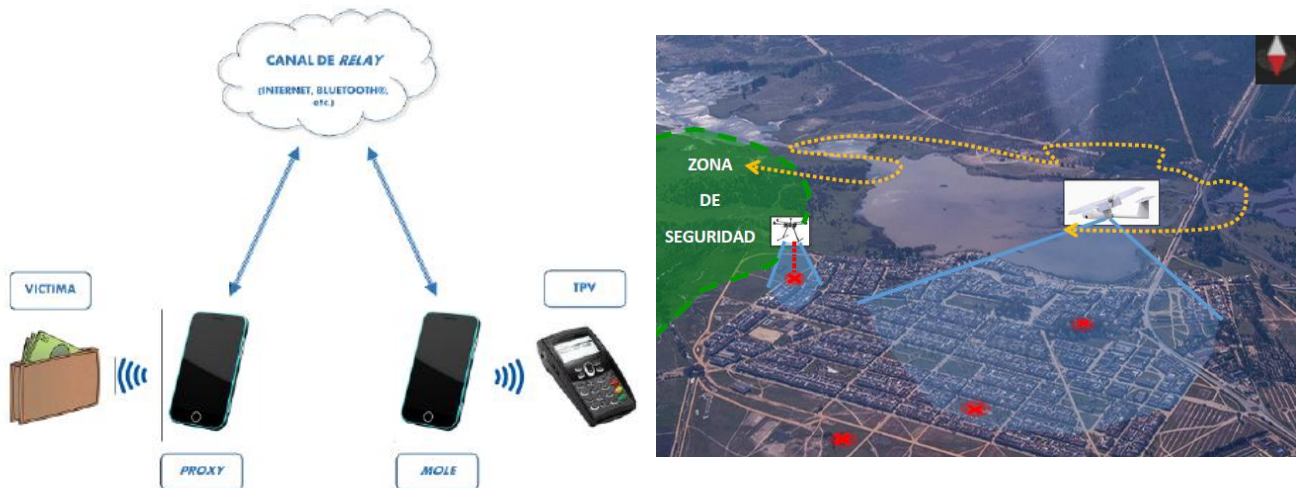
Figura 3. TFG enfocado a las tecnologías aplicadas a la investigación. a) Esquema de un ataque de "relay"[12]. b) colocación RPAS en la Aldea, Romería del Rocío (Huelva)[14]

Otra medida que es objeto de estudio son los sistemas de reconocimiento de huella dactilar a gran escala[13]. Los sistemas de reconocimiento de huella dactilar han ido apareciendo progresivamente en empresas e instituciones, el hecho de que sean implantados en fronteras y controles de acceso a gran escala invita a pensar que estos sistemas están preparados para realizar esta función de seguridad. En este TFG se realizó un detallado estudio de diferentes variables como los equipos (hardware) utilizados, que adquieren la imagen, las almacenan y soportan los algoritmos; se desarrolló una comparación del reconocimiento por huellas con otras técnicas.