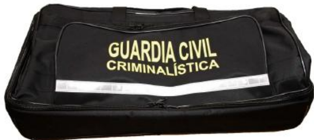
Figura 4. TFG enfocado a las ciencias forenses a) Contenido de "com.whatsapp"[15]. b) Material empleado por los ESIN (Especialista en Investigación de Incendios[16].