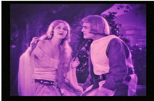
4. Plano 346