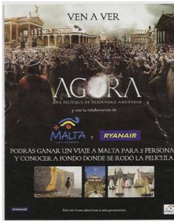
Figura 3. Cartel publicitario de Ágora .

Prueba de la complejidad que está adquiriendo este proceso de comercialización del lugar filmado resulta la evidencia de que en él ya no sólo intervienen la administración y la productora sino que tienen cabida terceros agentes como las compañías de transporte de viajeros. Por ejemplo, con motivo del estreno de Ágora dirigida por Alejandro Amenábar, la publicidad de la película animaba al espectador-turista, mediante sorteos de viajes, a visitar la isla de Malta – donde se rodaron las escenas supuestamente ambientadas en Alejandría – coincidiendo con la apertura de una ruta aérea de una compañía de bajo coste (figura 3).