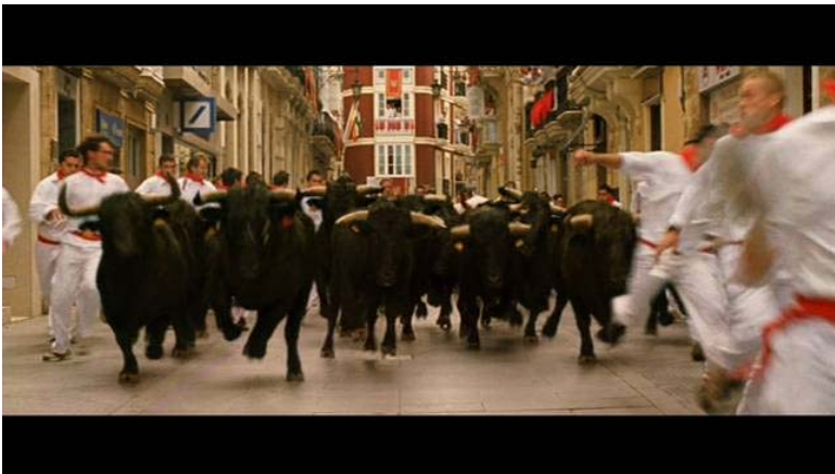
Figura 2. Carrera de toros de San Fermín en las calles de Sevilla.

Fuente: Mangold, J. (2010): Knight and Day .