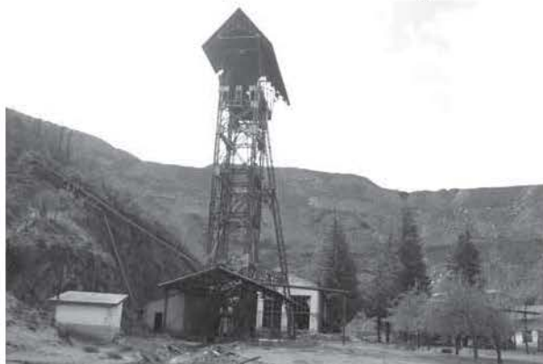
Figura 2. Castillete del "Pozo Ibarra" en Ciñera, La Pola de Gordón (León).

sociales que componen el patrimonio cultural inmaterial. Las características de la vida en los pueblos mineros estuvieron marcadas por las rápidas transformaciones económicas, sociales e ideológicas. La eminente manifestación de cambio fue el paso de una «economía de subsistencia», que combinaba minúsculas heredades labradas con la cría del hato ganadero y los trabajos temporales en el monte, al surgimiento de «actividades extraagrarias o no agrarias» que permiten el nacimiento de una agricultura a tiempo parcial para los obreros de la mina (picadores, barrenistas, entibadores, camineros, etc.). Otro apartado comprende los logros en los aspectos sociales, amparados en una subcultura propia, que tenían como motivación la lucha reivindicativa de mejoras laborales en las faenas mineras: la consecución de jornadas de 9 horas en el interior de la mina y 10 horas en el exterior, el descenso de la alta siniestralidad, el aumento de los niveles salariales, la dotación de viviendas dignas por el hacinamiento de trabajadores, etc. Las protestas obreras tenían un lazo común ideológico en los movimientos asociativos y sindicales que se manifestaron en la prensa y en los conjuntos escultóricos. También, las mudanzas alcanzaron a las costumbres, tradiciones y festividades y, por ejemplo, la celebración de Santa Bárbara, el 4 de diciembre, está incluida en el calendario festivo de los pueblos mineros.