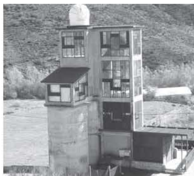
Figura 4. El "Mirador de las Estrellas" en San Cebrián de Mudá (Palencia).