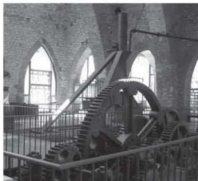
Figura 5. "Cuerpo de engranajes" en la nave central del Museo de la Siderurgia y la Minería de Castilla y León en Sabero (León).