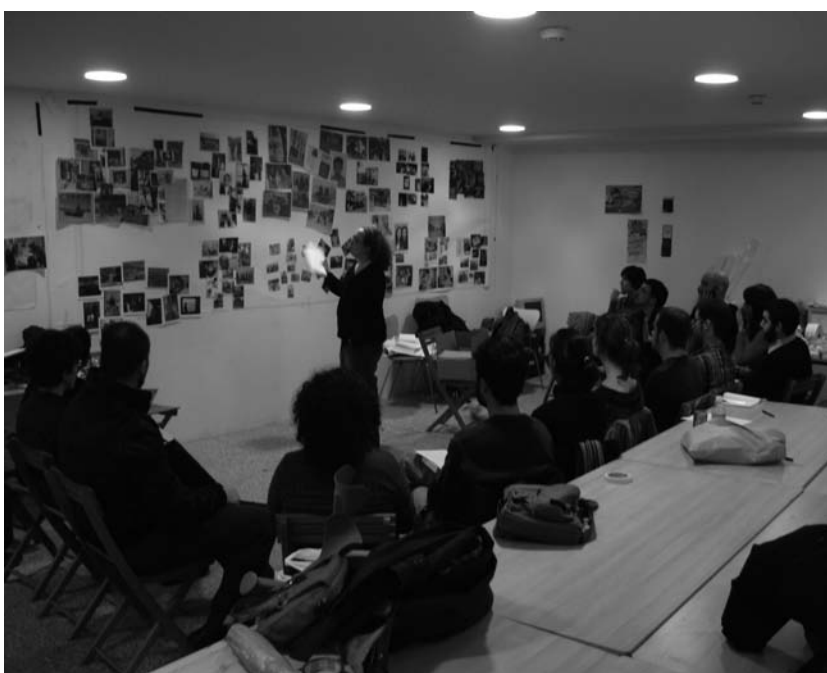
Fotografía 5: Mediabiografía, Museo Nacional Reina Sofía, Madrid, Virginia Villaplana, 2010.