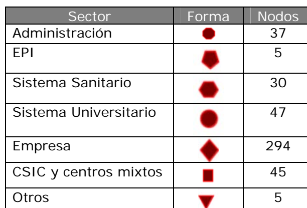
Tabla 1. Adscripción sectorial de las instituciones

La adscripción sectorial de las 463 instituciones que integran la red aparece desglosada en la tabla 1. Como en el párrafo previo se indica que la red está centrada en las relaciones de coautoría de las empresas con otras instituciones, ese sector concentra el mayor número de nodos, un total de 294. En esa misma tabla también se incluye la forma con la que cada institución quedará representada, en función de la adscripción de los nodos a un determinado sector.