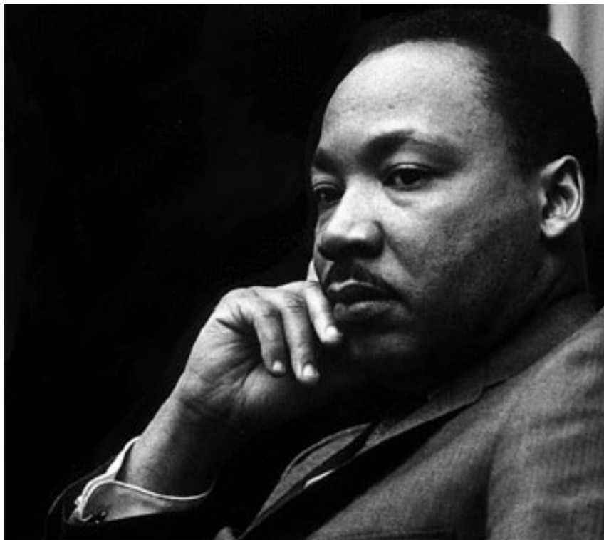
Imagen 1. Evolución de Martin Luther King a través de su gesto, o lo que es lo mismo diferentes interpretaciones de ese gesto (¿es una pose?).

El gesto y la pose. ¿Se puede estudiar qué es el gesto y qué es la pose? O tal vez por el hecho de saber que nos fotografian ya se produce la pose. No es una cuestión baladí. Importantes fotografías históricas han sido captadas sin pose, pero hay algunas que la mantienen. Hasta donde llega el rostro y dónde empieza la máscara. Se puede posar manteniendo un segundo un gesto, un maquillaje transitorio pero con capacidad de perduración. No significa que sea falso, pero tiene intencionalidad. Y sonreír un instante no cuesta demasiado. Estar siempre sonriente, en cambio, es duro, tanto como no sonreír jamás. ¿Podría ser una pose el gesto adusto y distante de King?