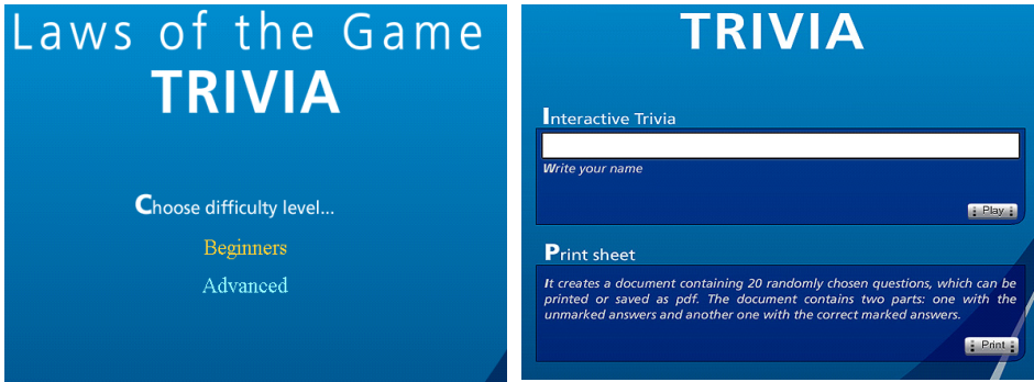
Figura 2izq.. Selección del nivel de dificultad. Figura 2der. Opciones de identificación y de imprimir un test en blanco.

respuestas correspondientes a las preguntas cargadas en la versión del test para facilitar la corrección del evaluador.