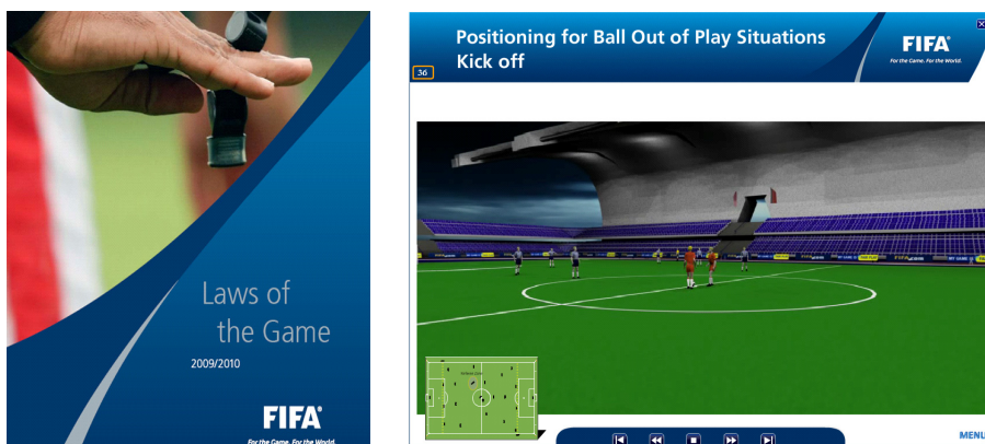
Figura 1. izq.) Portada del libro oficial de las “Reglas de Juego” der.) Captura de pantalla de los “Materiales de Aprendizaje Multimedia”

Todas las contribuciones que aportaron estos materiales fueron de gran utilidad, especialmente como referencias de diseño para generar un modelo coherente con las experiencias del usuario en los demás materiales. Por otra parte, el recurso debía permitir la evaluación del estudiante y las prácticas de autoevaluación. Se decidió que el modelo más apropiado sería un juego de