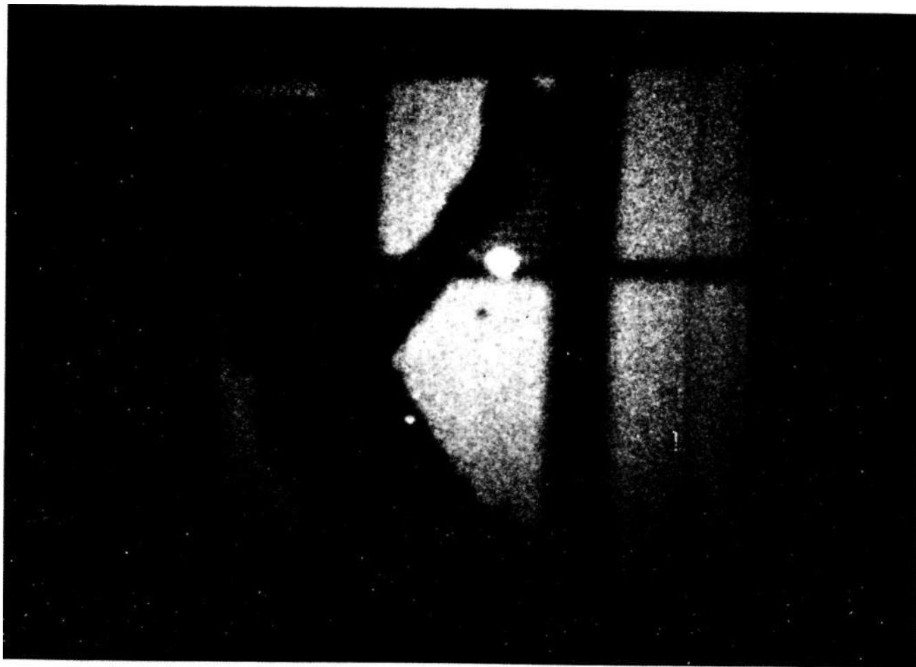
A mal ga ma , de Iván Zulueta (1976)