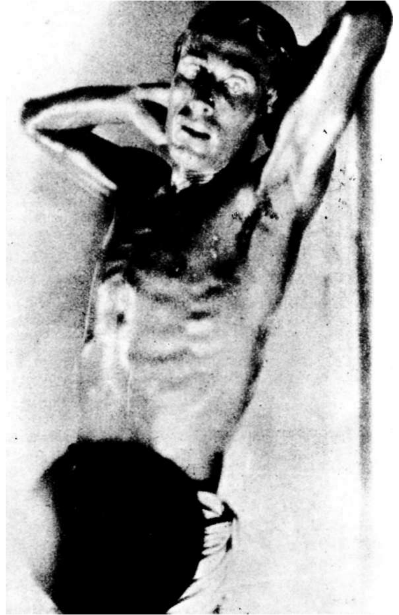
Al Hollywood madrileño, de Nemesio Sobrevila (1927)