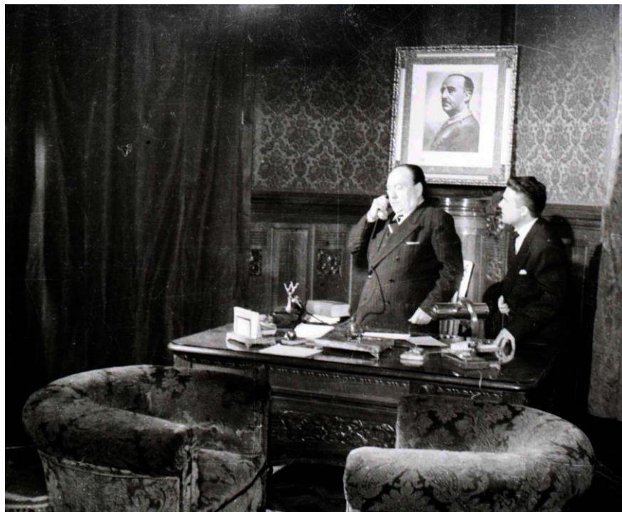
Esta escena, de una supuesta conversación entre el catedrático de instituto y el ministro de educación no se incluyó en el montaje final, posiblemente por la presencia del gran retrato de Franco y se sustituyó por otra, rodada en otro decorado donde se colgó un paisaje.