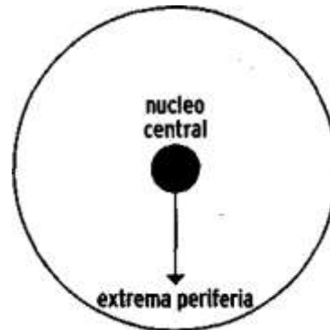
Figura 5 Dirección de la Transmisión de Nuevos Valores Sociales desde el Centro a la Periferia

Fuera de los análisis a nivel macro, la mayoría de los estudios sobre la conciencia ambiental se sitúan en un plano micro , del análisis de los valores, actitudes, creencias y conductas individuales, con perspectivas sicosociales sobre todo basadas en el individualismo metodológico, y concluyendo en que existe una contradicción entre lo que la gente dice que hace y lo que realmente hace, y ello se asemeja a los valores y el comportamiento. Sin embargo, y con independencia de las contradicciones que los individuos e instituciones presentan (consciente o inconscientemente) en su vida cotidiana, la explicación requiere de análisis más detallados, así como avanzar en el nivel meso escasamente considerado.