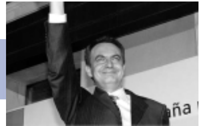
Хосе Сапатеро, новый премьер- министр Испании

до недавних выборов, позволяло ей принимать решения огромной политической важности зачастую вопреки мнению объединенной оппозиции из остальной части Конгресса. Эти решения касались реформ уголовного кодекса, системы образования и налогообложения и совсем недавнего, очень спорного вопроса об участии в иракской войне.