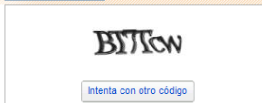
Figura 3: CAPTCHA ofrecido después de un intento

En la Figura 3 se propone la introducción de un nuevo código para poder seguir adelante en el registro de una cuenta de correo electrónico, previo fallo de la anterior imagen. El problema es que este proceso se repite varias veces hasta que se logra introducir correctamente uno de los códigos mostrados.