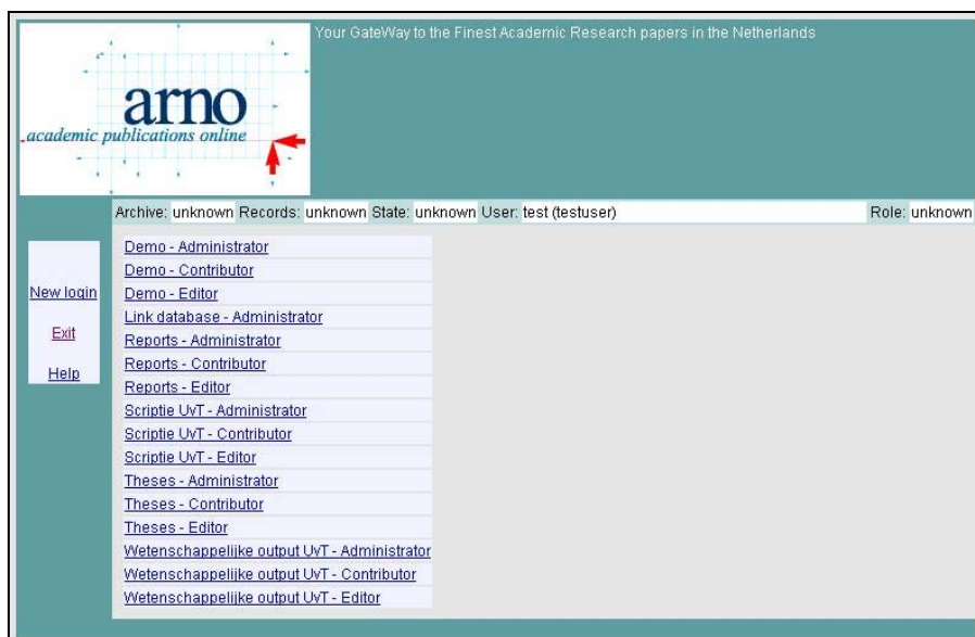
Figura 8.7. Captura de pantalla del sistema ARNO, selección del repositorio 32 .

El proyecto holandés ARNO ( Academic Research in the Netherlands On line ) comenzó en septiembre del 2000 a través de una colaboración de la Universidad de Tilburg, la Universidad de Twente y la Universidad de Ámsterdam. Además de diversas investigaciones de interés sobre el tema de la comunicación académica digital, uno de los resultados más importantes de este proyecto es el software del mismo nombre, ARNO, que cuenta con una media docena de implementaciones, todas en universidades holandesas y dentro de la red de repositorios institucionales DAREnet 31 .