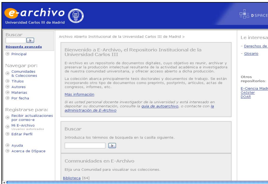
Figura 8.3. Página principal del repositorio e-Archivo de la Universidad Carlos III de Madrid, construido con DSpace [ http://e-archivo.uc3m.es:8080/dspace ]

DSpace ( http://www.dspace.org ) ha sido desarrollado conjuntamente por los laboratorios Hewlett-Packard y por la biblioteca del MIT (Massachusetts Institute of Technology) específicamente para constituir servicios de repositorio institucional. DSpace es un sistema diseñado para la captura, almacenamiento, indización, preservación y redistribución de la producción intelectual del personal investigador de la universidad en formato digital. Disponible desde noviembre del 2002, y distribuido mediante una licencia BSD ( Berkeley Software Distribution ), en mayo del 2007 ha publicado su versión 1.4.2 19 .