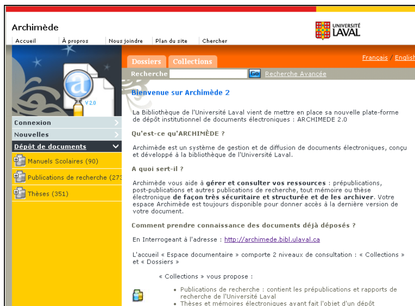
Figura 8.9. Página de inicio de Archimède en la Universidad de Laval