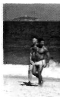
Imágenes 12, 13, 14, 15 y 16: Escenas aparecidas en diferentes propagandas turísticas de Brasil.

Las personas de color suelen tener un protagonismo en la propaganda turística que no tienen por lo general en los medios de comunicaciones nacionales y estatales, donde las de ascendencia europea son las que principalmente presentan los programas de televisión, actúan en las telenovelas y en los anuncios publicitarios, salvo en casos más excepcionales como los del estado de Bahía. En la propaganda turística aparecen porque, al igual que las playas tropicales, los cocos o los papagayos, simbolizan lo diferente y lo exótico para los potenciales turistas de los países ricos.