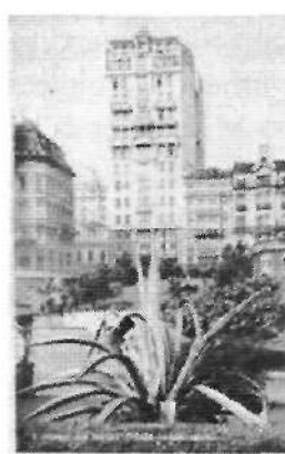
Imagen 2: Sao Paulo. Brasil. Parque Anhangabahú. Brasil : Wessel, [192-?].