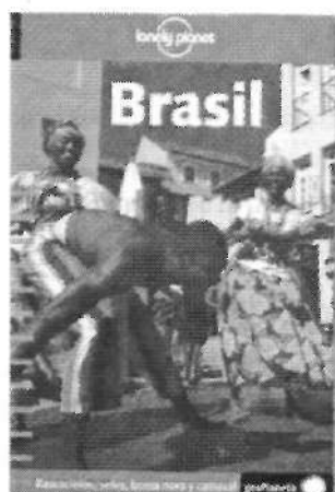
Imagen 8: Portada de la guía que Lonely Planet dedica a Brasil, del año 2002