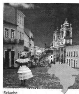
Imágenes 5, 6 y 7: Olinda (izquierda) y Salvador de Bahía en el catálogo que la agencia Traveplan dedica a Brasil para la temporada 2004