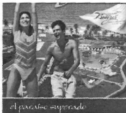
Imágenes 3 y 4: Publicidad de Brasil en los catálogos de las agencias Abreu y Travelplan de la temporada 2004

La mayor parte de las propuestas ya no tienen a Río de Janeiro como principal destino turístico, como sucedía años atrás 31 . Desde hace pocos años es el Nordeste del país, región que registra los índices nacionales más elevados de pobreza y en la que se espera que el turismo contribuya a impulsar su desarrollo, para lo cual cuenta con importantes potenciales. Entre ellos el rico legado cultural allí existente, un recurso que podría permitir la superación del actual planteamiento mono productivo de sol y playa que tan malos resultados ha generado en otras zonas del planeta (expulsión de las poblaciones autóctonas de sus pueblos, ruptura del tejido social a escala local y especulación del suelo, erradicación de zonas agrícolas o dependencia externa entre otros) 32 .