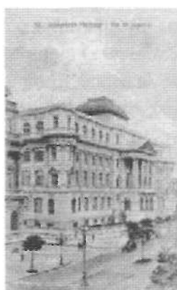
Imagen 1: Biblioteca Nacional, de Río de Janeiro. Brasil : Augusto Costa, [191-?]. Fondo FIHCA

Hacia mediados del siglo XX ésta última declinó a favor de San Pablo la hegemonía económica del país, ciudad que para entonces y tras el impulso generado por la producción cafetera y la construcción de importantes infraestructuras de comunicación, desarrollaba una frenética actividad comercial e industrial. La llegada masiva de inmigrantes europeos y de otras regiones del país le consolidaba como una importante y dinámica metrópoli, plasmando las tarjetas postales de la época las profundas transformaciones experimentadas en su área central con la construcción de imponentes rascacielos y amplias autopistas 22 . La altura concebida como emblema de lo moderno, de poder y de progreso, aspecto tan característico en las imágenes transmitidas por las ciudades norteamericanas 23 , se repiten en las referidas a la ciudad de San Pablo, considerada desde entonces como la "Nueva York de Latinoamérica".